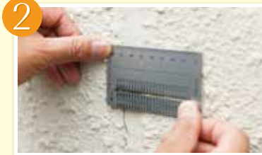
2 ヒビ割れの大きさを測り、度合いによって適正な工事方法をご提案します。