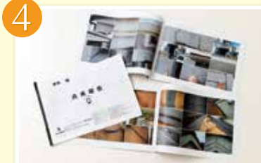
4 診断結果の写真をみせながら、専門用語を使わず丁寧に分かりやすく説明いたします。