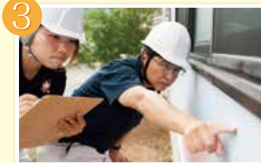
3 傷みの初期症状は見逃さず写真を撮ります。写真は全てお客様にお渡しします。