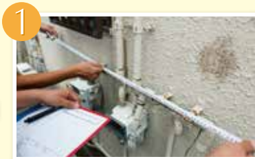
1 お家の大きさを測定することで適正なお見積りをご提示します。